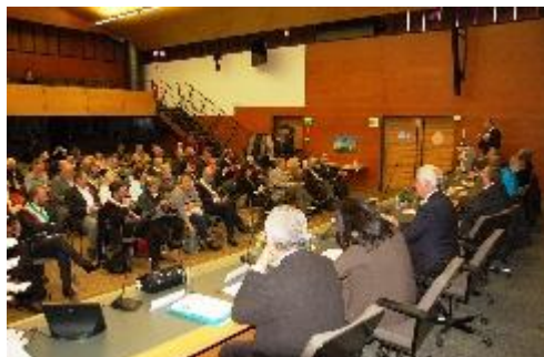
La costituzione della nuova Associazione Europea stamane in municipio