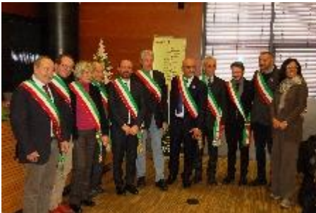
Sindaci nel nome della Via Romea